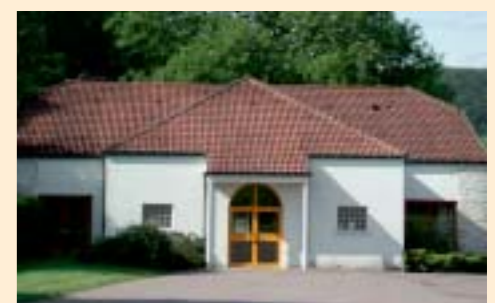
Salle polyvalente de Rennepont