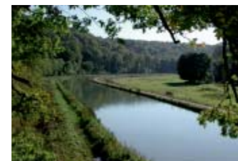
Canal entre Champagne et Bourgogne

Le Pays Chaumontais est une communauté de 19 communes : il a une fonction de réalisation d'investissements et de gestion de services grâce à une fiscalité propre.