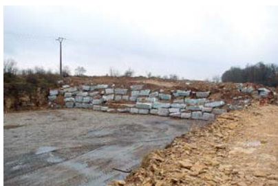
Stockage sous film plastique des déchets amiantés