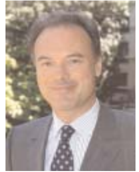
Renaud Dutreil le nouveau ministre de l'Artisanat et des PME

Afin de faciliter l'appréciation de la valeur réelle d'une entreprise, le cédant est tenu de fournir en plus des documents comptables des 3 derniers exercices, le récapitulatif du chiffre d'affaires mensuel réalisé depuis le dernier bilan.