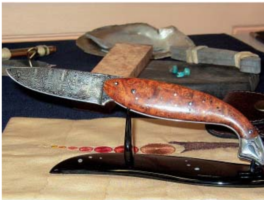
Le couteau « saumon » de Monsieur Erwan Pincemin, lauréat 2005 du Prix Départemental des Métiers d'Art.