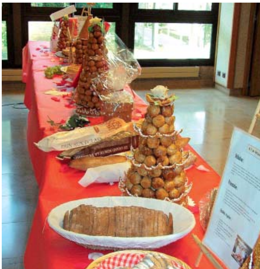
Les élèves de 4 e et de 3 e à la découverte de nos métiers.