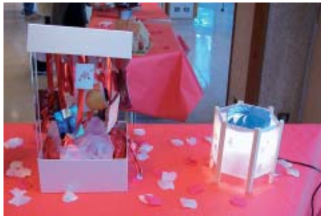
Différents travaux réalisés par les jeunes dans le cadre de l'opération

Cette année encore, cette rencontre du monde de l'enseignement et de celui de l'Artisanat fut réciproquement enrichissante. La richesse et la modernité de nos métiers seront, souhaitons-le, sources de vocations.