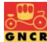
Groupement National des Carrossiers Réparateurs